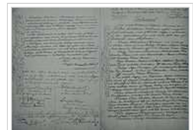
Testament Alfred Nobels, mit dem er den Nobelpreis stiftet