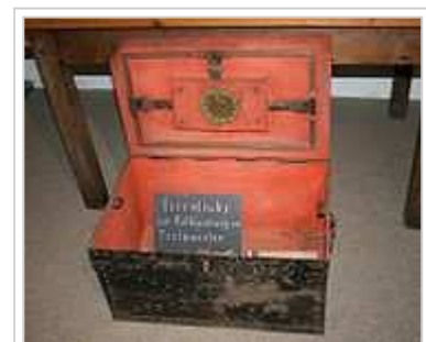
Historische Eisentruhe zur Aufbewahrung von Testamenten

Ein Problem stellt das Verlorengehen oder die Nichtauffindbarkeit eines Testaments dar. Öffentliche Testamente werden vom Notar stets in die amtliche Verwahrung des Nachlassgerichtes gegeben. Auch privatschriftliche Testamente können von den Testierenden beim Nachlassgericht in amtliche Verwahrung gegeben werden. In allen Fällen lässt das Nachlassgericht beim Geburtsstandesamt des Testators einen Hinweis auf das verwahrte Testament anbringen. Bei der Sterbefallbeurkundung erhält das Geburtsstandesamt eine Kontrollmitteilung und überprüft, ob sich ein Eintrag über eine Testamentsverwahrung am Geburtseintrag befindet. Dann wiederum verständigt das Standesamt das Nachlassgericht. Bei nicht amtlich verwahrten Testamenten hat jeder, der ein solches nach dem Tod des Testators auffindet oder für diesen verwahrt, dieses beim Nachlassgericht abzuliefern (§ 2259 BGB).