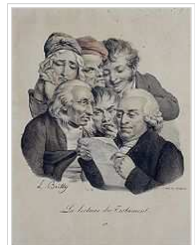
„Das Lesen des Testaments“ (frz. Karikatur des 19. Jh.)

Beim Tod eines Menschen, der kein wirksames Testament errichtet (oder einen Erbvertrag geschlossen) hat, tritt die gesetzliche Erbfolge ein. Diese Erbfolge entspricht nicht unbedingt den Vorstellungen des Erblassers und kann zu Streitigkeiten unter den Angehörigen führen, die der Erblasser durch eine klare testamentarische Regelung vermeiden kann. Zum Beispiel regelt die gesetzliche Erbfolge, dass in einer kinderlosen Ehe die Eltern neben dem überlebenden Ehegatten Erben werden und mit diesem eine Erbengemeinschaft bilden. Oft stimmt auch die gesetzliche Regelung, dass die Kinder neben dem überlebenden Ehegatten erben und somit auch hier eine Erbengemeinschaft bilden, nicht mit dem letzten Willen des Erblassers überein. Wer dies vermeiden möchte, muss die Erbfolge durch ein Testament (oder einen Erbvertrag) regeln.